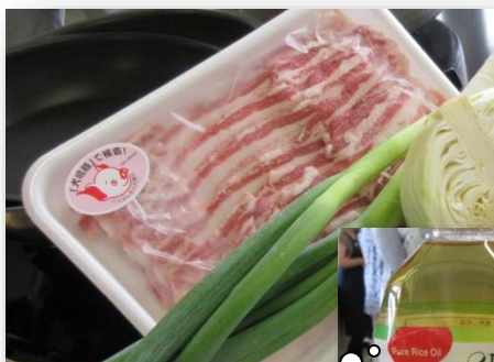
犬鳴ポーク&こめ油 実習に使いました！

*今回、残念ながら参加できなかった会員の皆様も次回はぜひ参加して頂き意見交換、または色々な職種の方のお話を聞くだけでも、今後の仕事や生活の参考になると思いますよ。